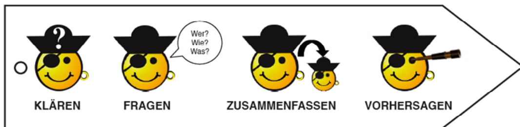
Abb. 1: Rollenbilder und Strategieabfolge aus dem Förderprogramm „Lesetraining mit Käpt’n Carlo“ (Spörer u.a. 2016)